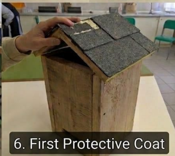
6. First Protective Coat