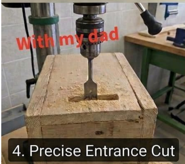
4. Precise Entrance Cut