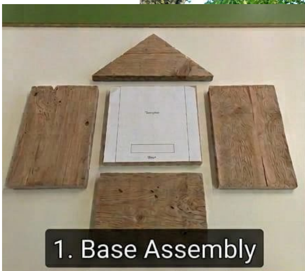
1. Base Assembly